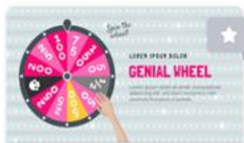
GENIAL WHEEL QUIZ

- 2 predloška u besplatnom korisničkom računu