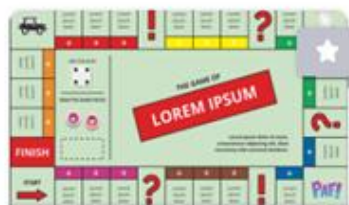
BOARD GAME 2