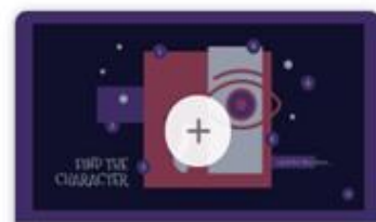
FIND THE CHARACTER