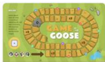
GAME OF THE GOOSE