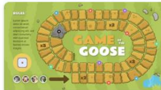
GAME OF THE GOOSE

- 2 predloška u besplatnom korisničkom računu