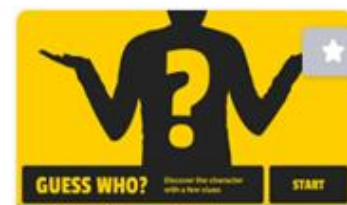
GUESS WHO? GAME